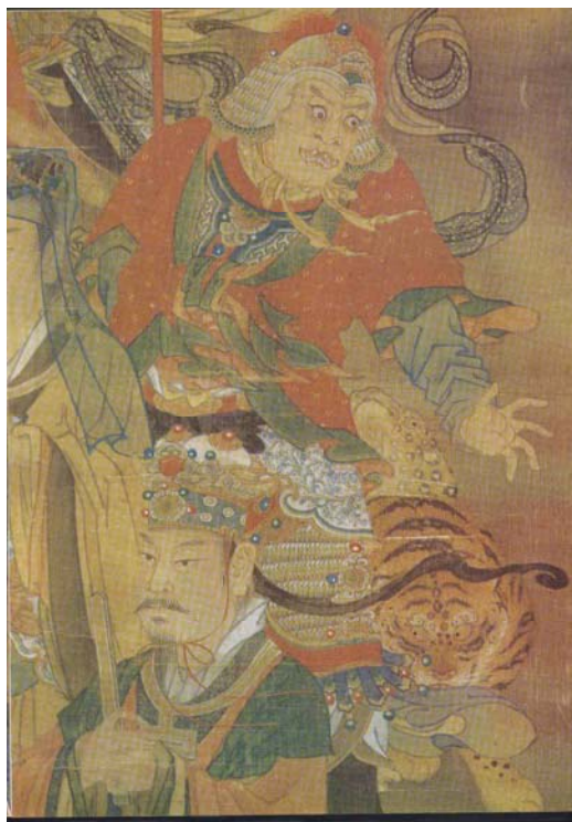
【圖 23】明代寶寧寺水陸畫：尾宿