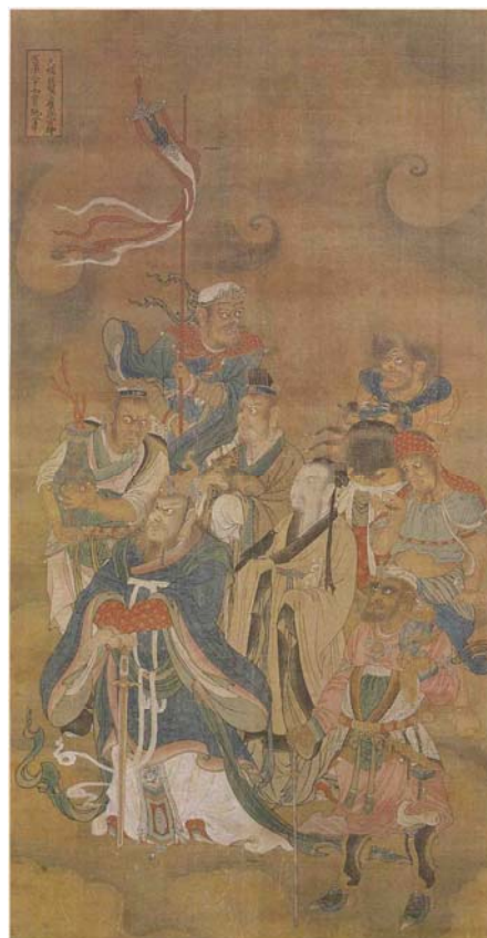
【圖 29】明代寶寧寺水陸畫： 寶瓶金牛天蠍巨蟹魔羯宮神