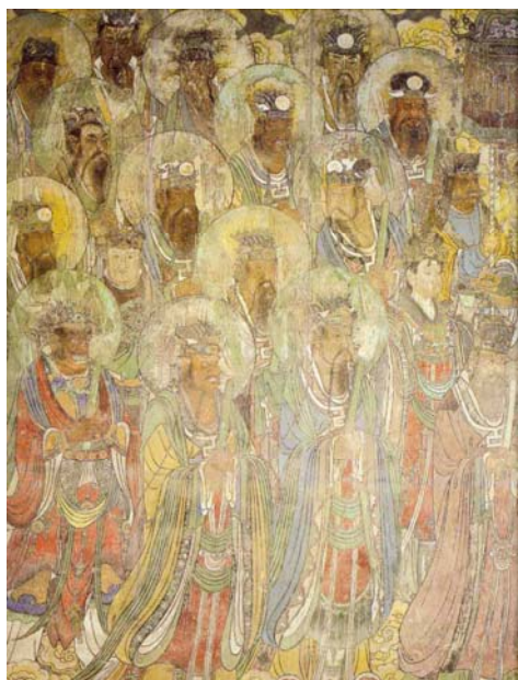
【圖 18】勾陳星宮大帝右側星宿的局部圖