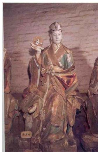
【圖 3】元代山西玉皇廟二十八宿塑像： 危月燕