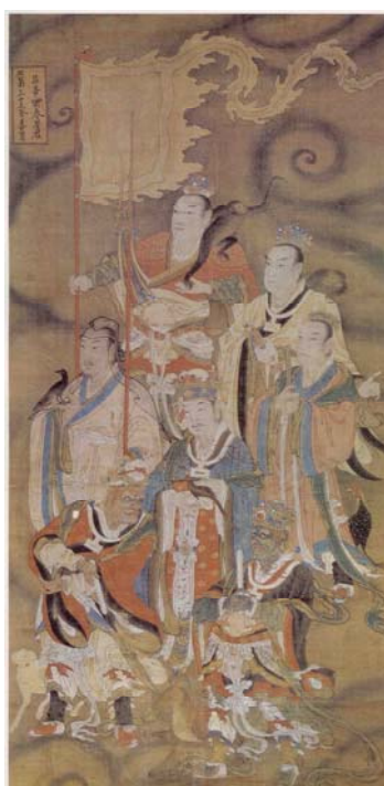
【圖 26】明代寶寧寺水陸畫：奎婁胃昂畢觜參星君 (西方白虎七宿)