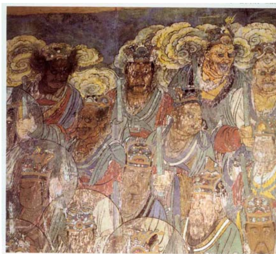
【圖 11】紫微大帝右側局部