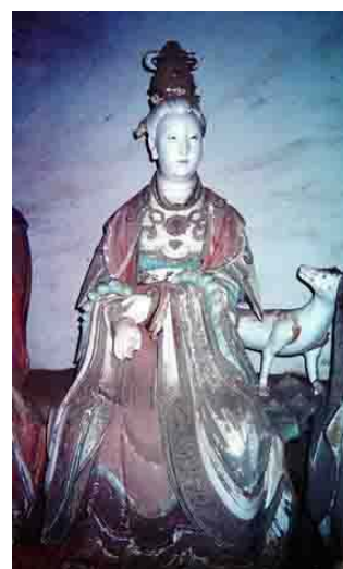
【圖 7】元代山西玉皇廟二十八宿塑像： 婁金狗