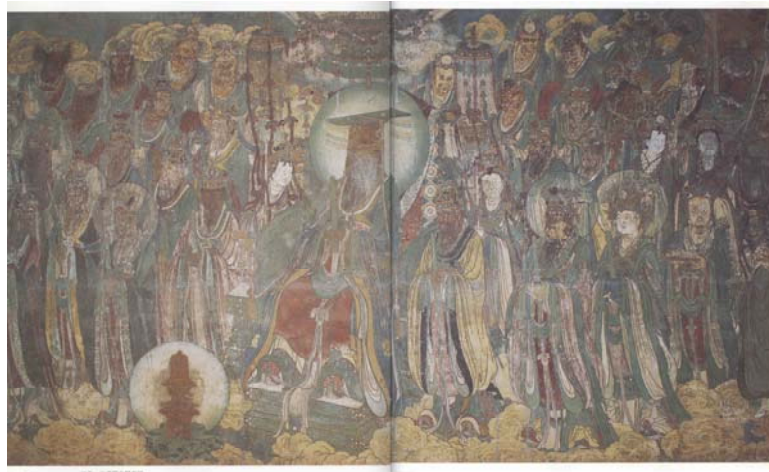
【圖 9】元代永樂宮三清殿北壁東側