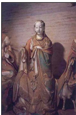
【圖 4】元代山西玉皇廟二十八宿塑像： 虛日鼠