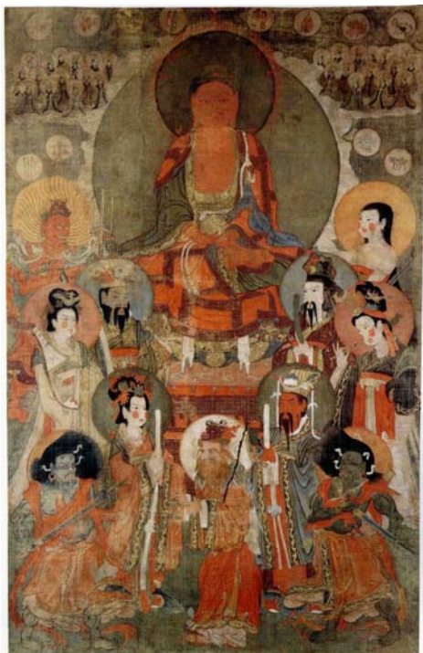
【圖 28】十一世紀西夏黑水城《熾盛光佛與星宿神》