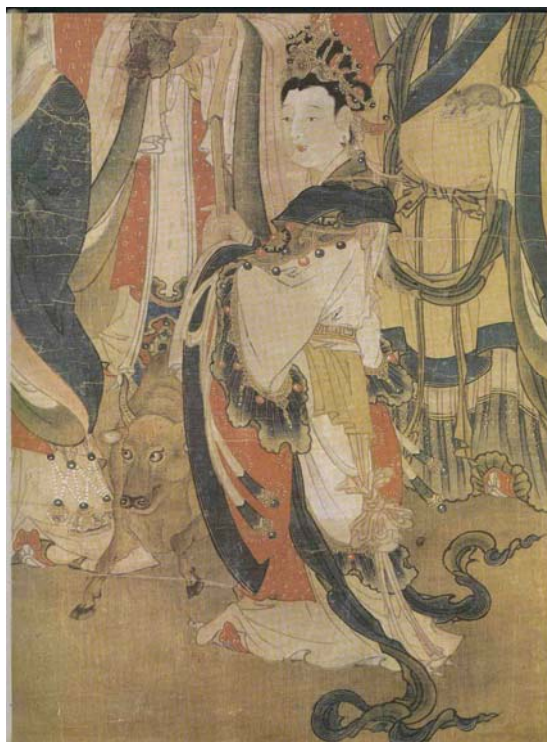
【圖 24】明代寶寧寺水陸畫：牛宿