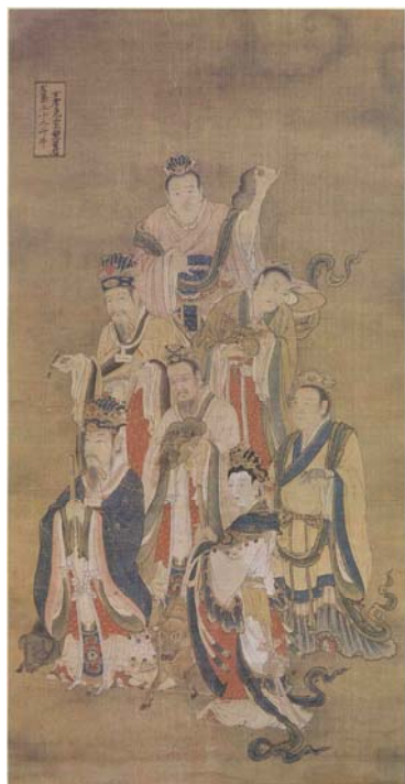
【圖 25】明代寶寧寺水陸畫：斗牛女虛危室壁星君 (北方玄武七宿)