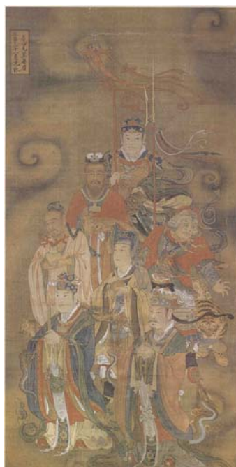
【圖 22】明代寶寧寺水陸畫：角亢 氐房心尾箕星君（東方蒼龍七宿）