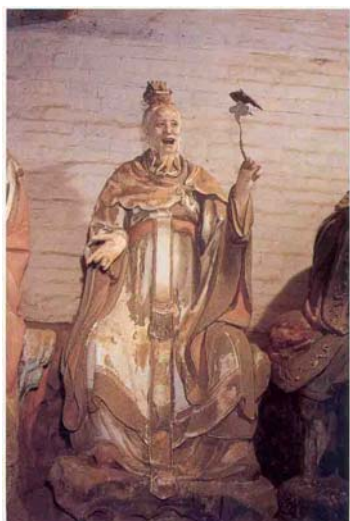
【圖 2】元代山西玉皇廟二十八宿塑像： 女土蝠