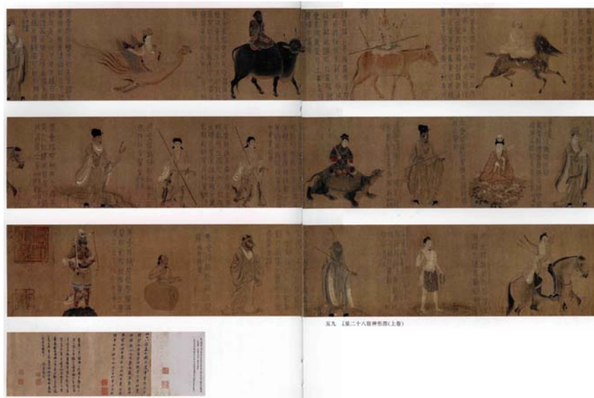
【圖 1】(傳)唐 梁令瓚《五星二十八宿神形圖》