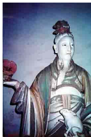
【圖 5】元代山西玉皇廟二十八宿塑像： 房日兔