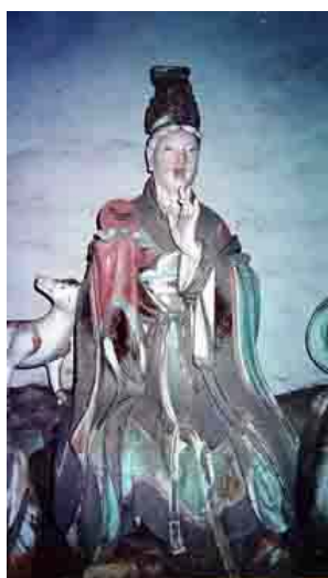
【圖 6】元代山西玉皇廟二十八宿塑像： 昴日雞