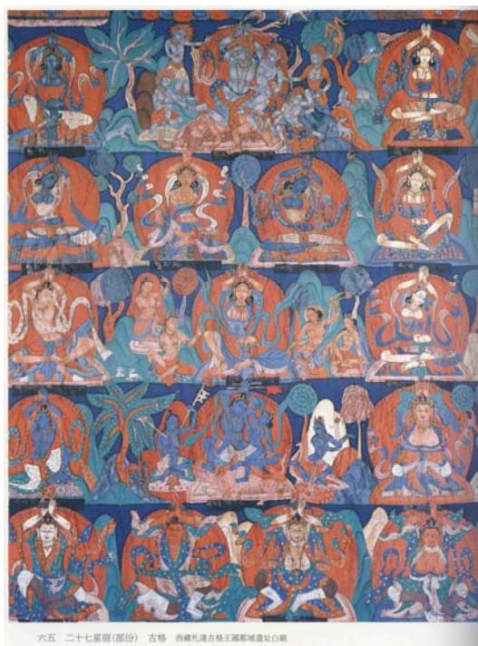
【圖 31】西藏自治區札達縣古格王國都城中 壁畫作品《西藏古格王國二十七星宿》（部分）