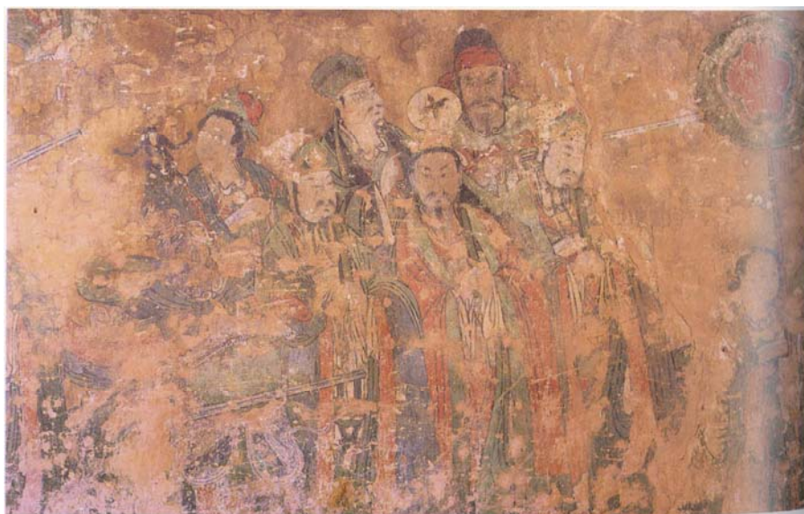
【圖 21】元 代陝西耀縣 南庵《朝元圖 （二十八宿 諸星君）》