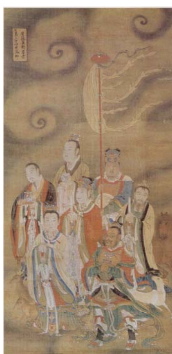
【圖 27】明代寶寧寺水陸畫：井鬼柳星張翼軫星君 (南方朱雀七宿)