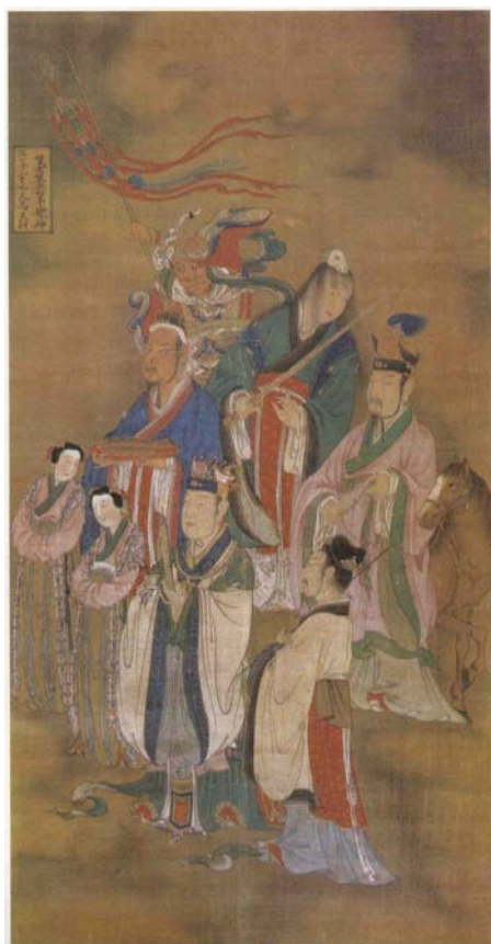
【圖 30】明代寶寧寺水陸畫： 天馬天秤雙魚白羊獅子宮神