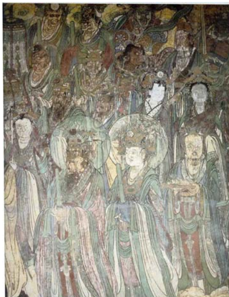
【圖 15】紫微大帝左側星宿的局部圖