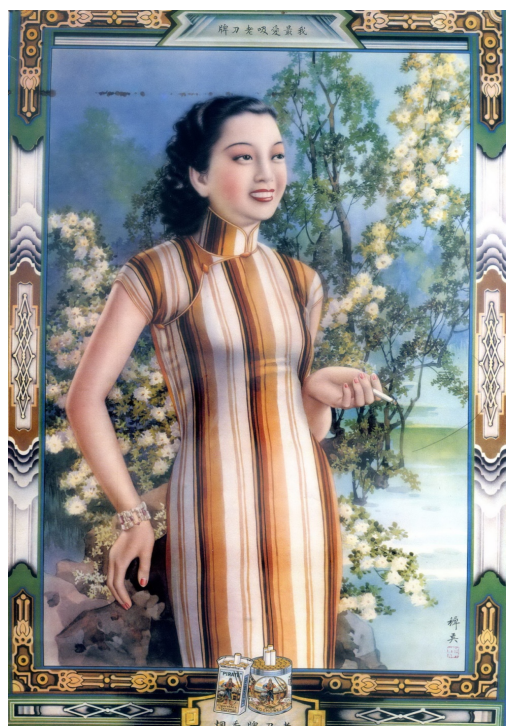
【圖 12】釋英畫室， 《英美煙公司老刀牌香菸月份牌廣告畫》，1930 年代末期。