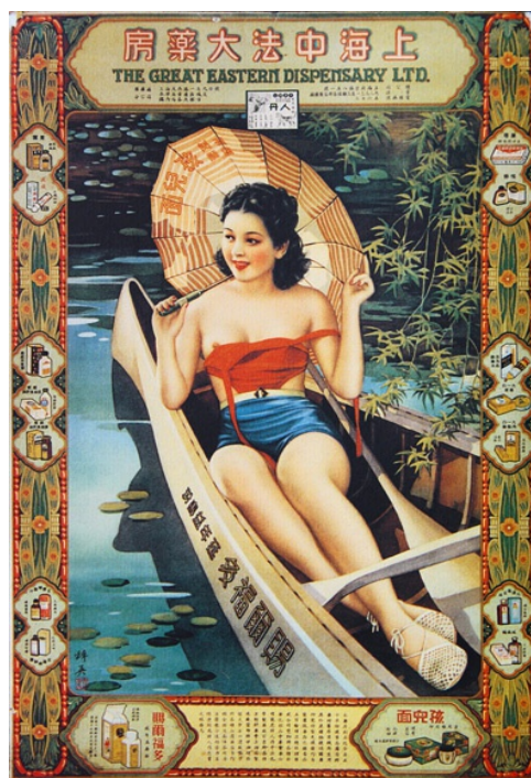
【圖 16】穉英畫室，《中法大藥房月份牌廣 告畫》，應於 1930 年代繪。