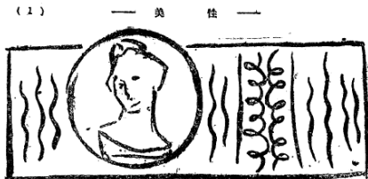
【圖6】張競生，〈裸體研究：由裸體畫說到許多事：為曉江氏女體速寫而作〉。