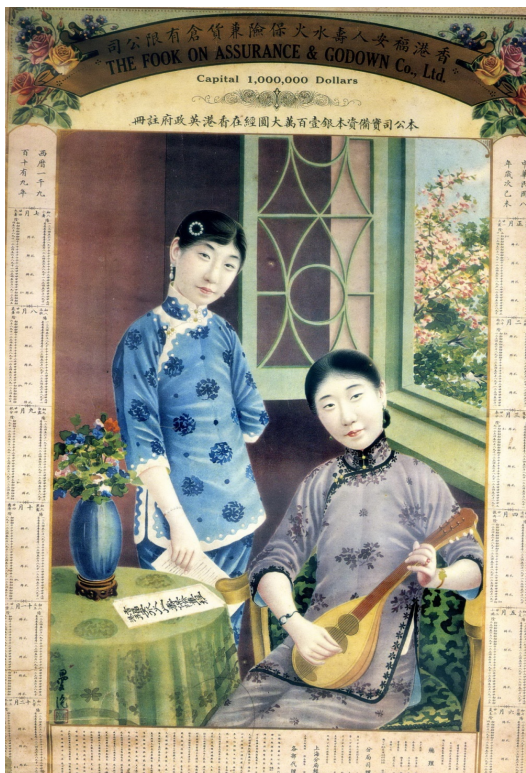
【圖8】鄭曼陀，《香港福安人壽水火保險公司月份牌廣告畫》，1919。