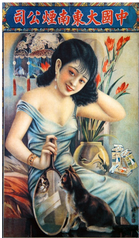
【圖 17】釋英畫室，《中國大東南煙公司廣告畫》，應於 1930 年代繪。