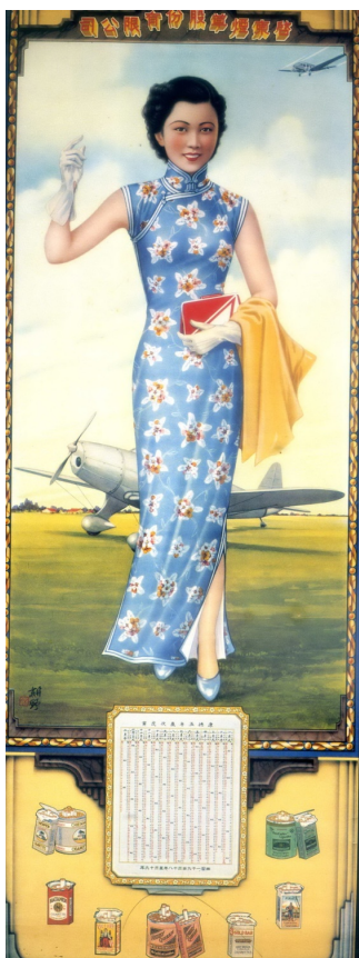
【圖 11】倪耕野， 《啟東煙草公司月份牌廣告畫》，1938。