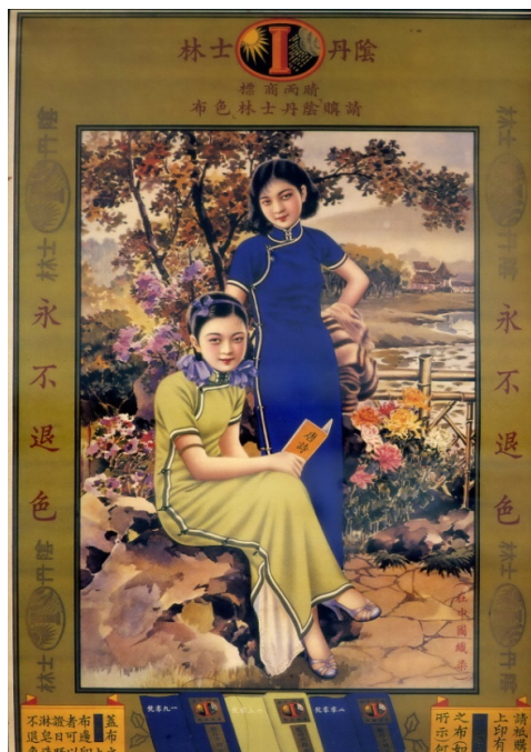
【圖 10】無署名， 《陰丹士林色布月份牌廣告畫》，1936。