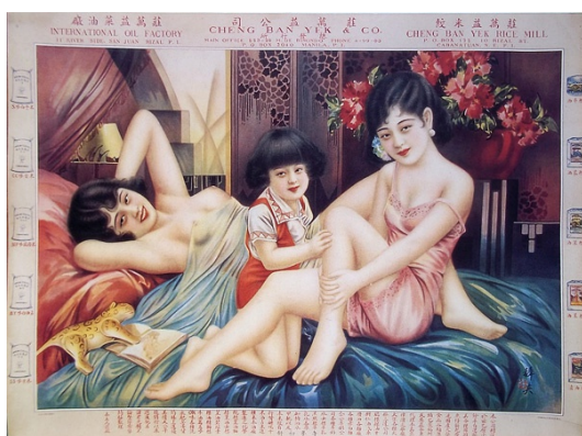
【圖 15】穉英畫室，《午夢初舒》， 應於 1930 年代繪。