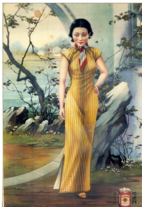
【圖 14】倪耕野，《哈德門香菸月份牌廣告 畫》，1930 年代末。